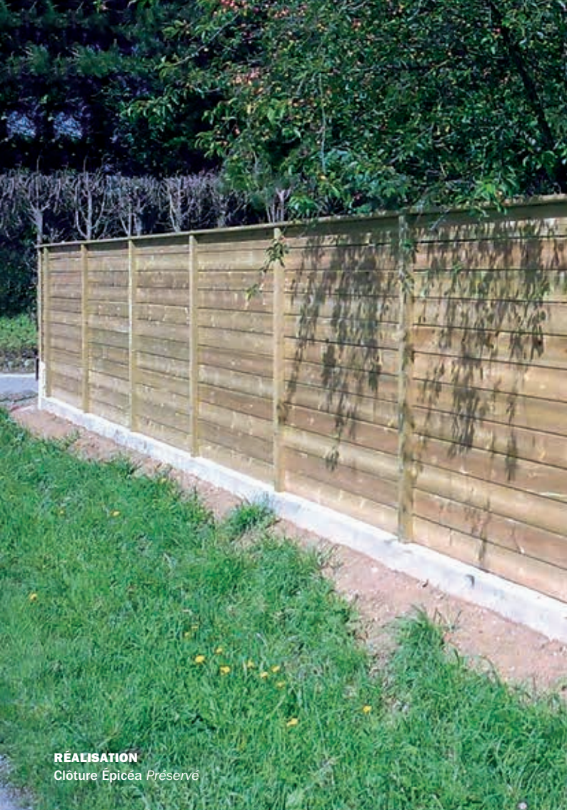
RÉALISATION Clôture Épicéa Préserve